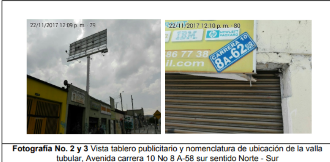
Fotografía No. 2 y 3 Vista tablero publicitario y nomenclatura de ubicación de la valla tubular, Avenida carrera 10 No 8 A-58 sur sentido Norte - Sur